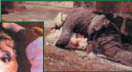
Saddam'ın Halepçe katliamından vahşet görüntüleri...